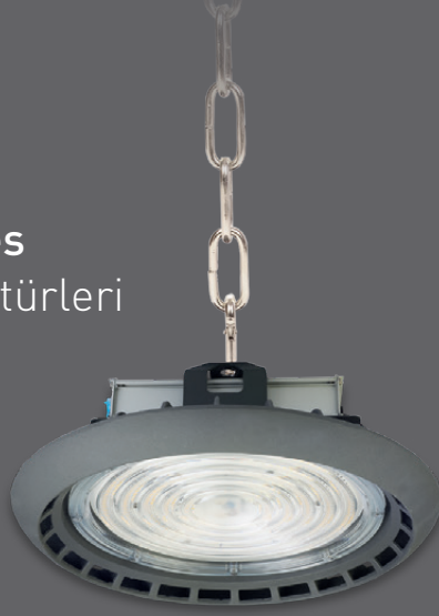
75W / 100W