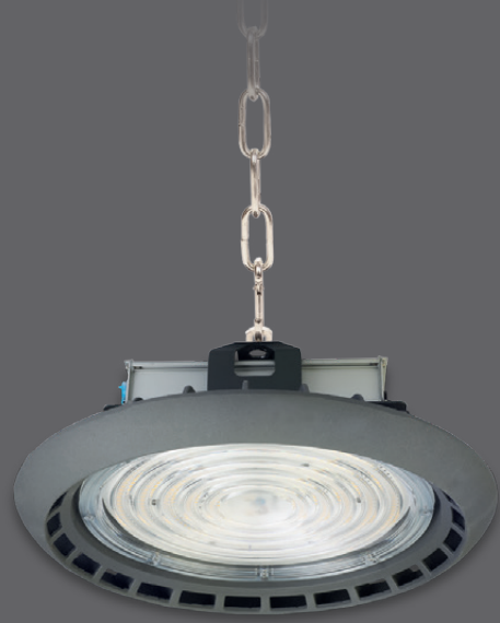
150W / 200W

5 years warranty 100.000h driver lifetime 10kV internal surge protection 45°/90° Lens Microwave sensor option